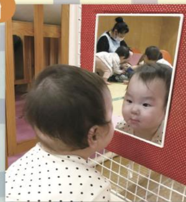
ごはんのあとは お顔をきれいに。。