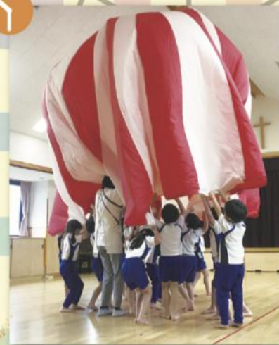
バルーンはみんな大好き