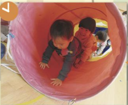
午前のお遊びは お兄ちゃんといっしょ