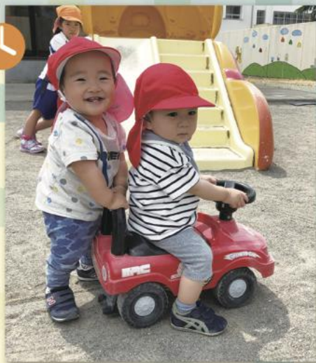
おひるねのあとは げんきいっぱい