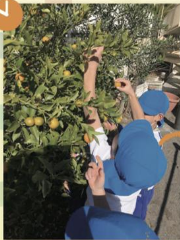
園の庭で金柑の収穫 甘いね！